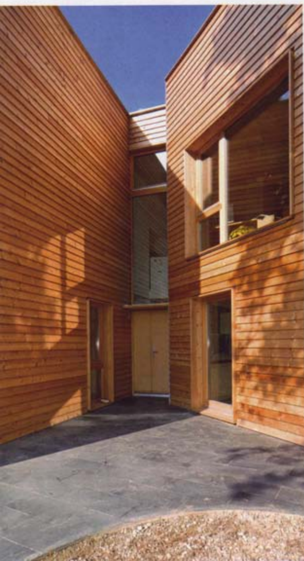
Hlavný vstup je situovaný do zárezu budovy.

čo však neznižuje ich kvalitu. Je to charakteristické pre prirodzené starnutie dreva.